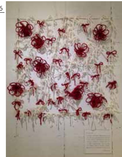
Title : TSURU ITO Size : 80cm × 80cm