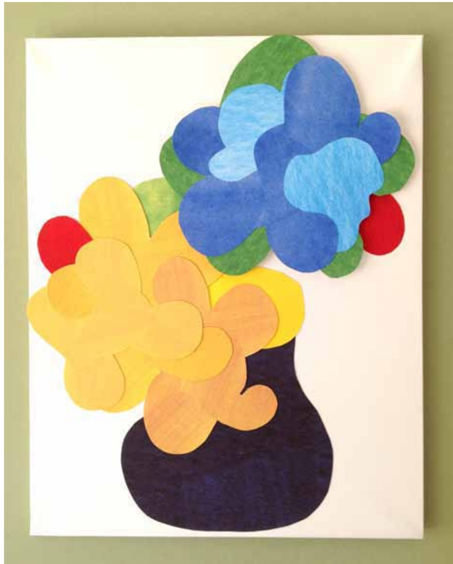
Title : Flower vase Size : 40 cm × 30 cm Price : sold