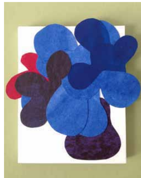
Title : Flower vase-青 Size : 23 cm × 18 cm Price : 4,500yen