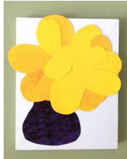
Title : Flower vase-黄 Size : 23 cm × 18 cm Price : sold