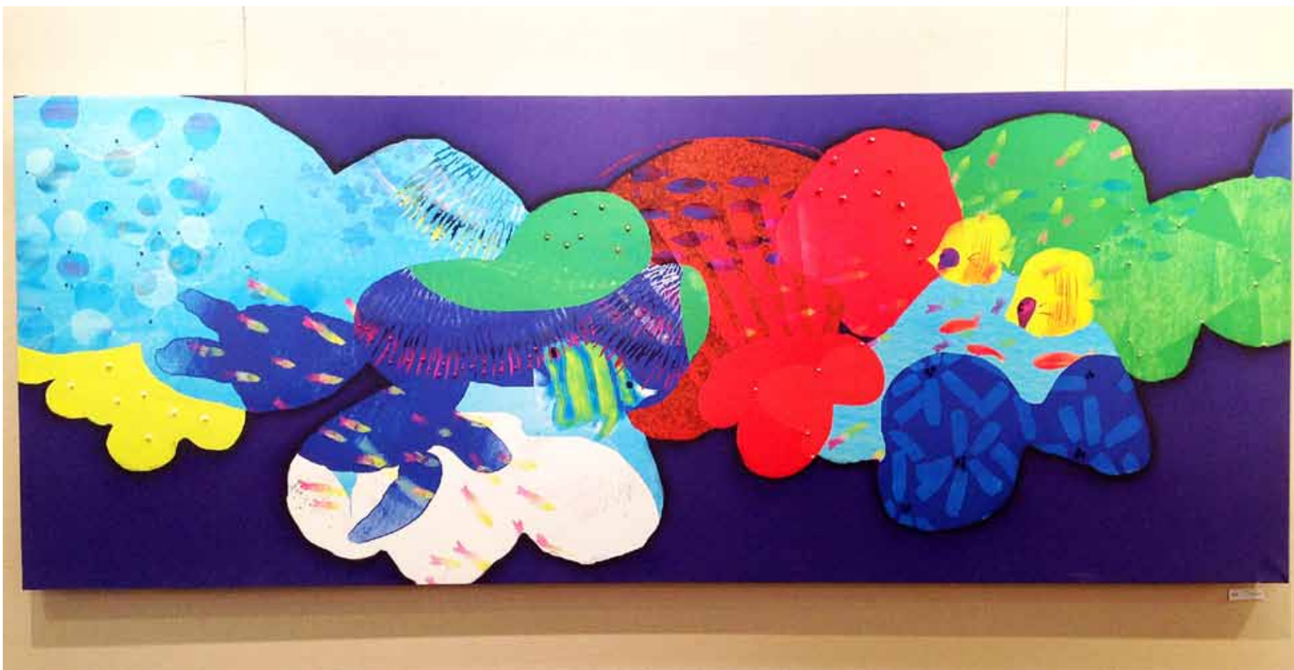
Title: 深海 Deep sea Size: 83cm×213cm Price: 150,000yen

南の海の明るく楽しい世界を高い彩度で表現した作品。丸めた和紙をコラージュして、サンゴに凹凸をつけたり、泳ぐ魚のヒラヒラ感を演出しています