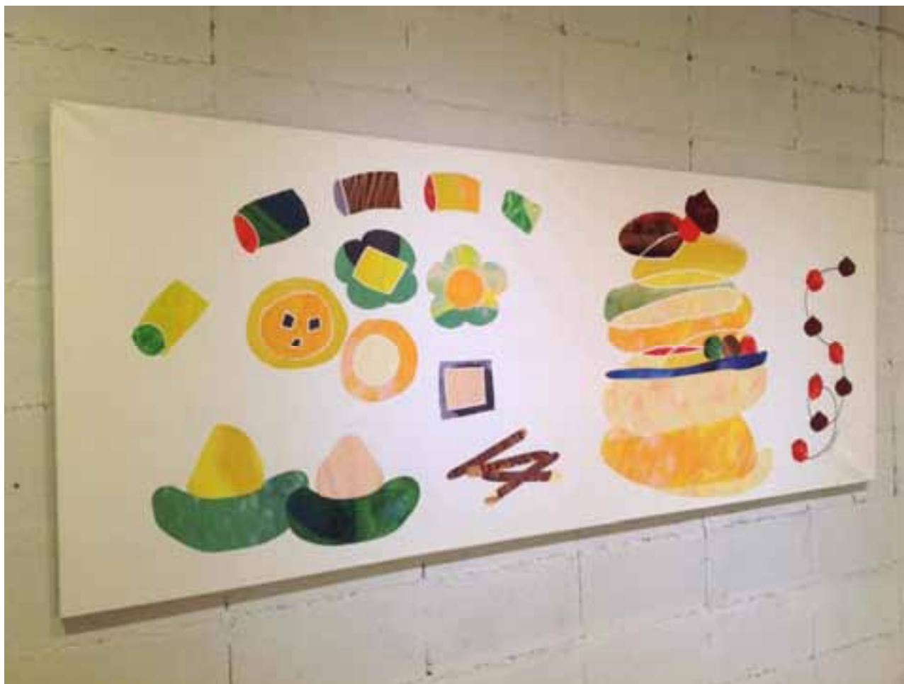
Title : sweets Size : 200cm × 84cm Price : 115500yen